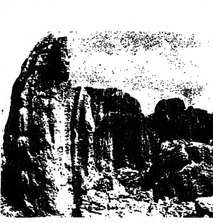
سور حيطان في منطقة كورنيجان